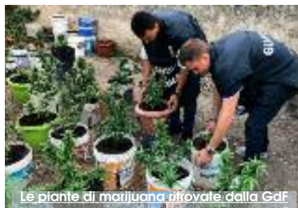
Le piante di marijuana ritrovate dalla Gdf

La Guardia di Finanza del Nucleo Mobile di Mazara del Vallo, coadiuvata dagli allievi marescialli impiegati nel piano per il potenziamento dei servizi di vigilanza estiva, hanno rinvenuto presso la località turistica "Tonnarella", un'abitazione all'interno della quale si praticava la coltivazione e lo spaccio di marijuana. Era una residenza estiva di un cittadino mazarese. I militari in servizio, notando nei pressi dell'abitazione dei "movimenti" sospetti da parte di ragazzi italiani e stranieri, si sono introdotti all'interno dell'appartamento per procedere ad una ispezione. Il proprietario dell'abitazione, un quarantenne mazarese già gravato da precedenti penali, è stato sorpreso dalla Tenenza dentro l'abitacolo e dalla successiva perquisizione locale sono stati rinvenuti circa 400 grammi di marijuana già essiccata e pronta per la vendita; 63 piante di canapa invasata di circa un metro di altezza ciascuna; 3 bottiglie di concime fertilizzante; 11 lampade