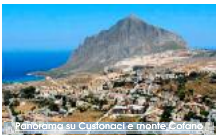
Panorama su Custonaci e monte Cofano