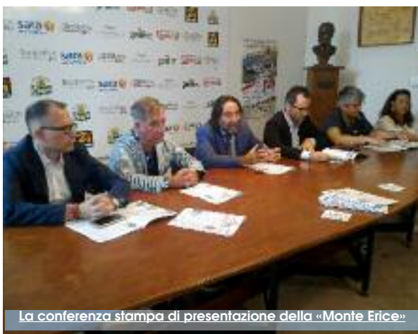
La conferenza stampa di presentazione della «Monte Erice»